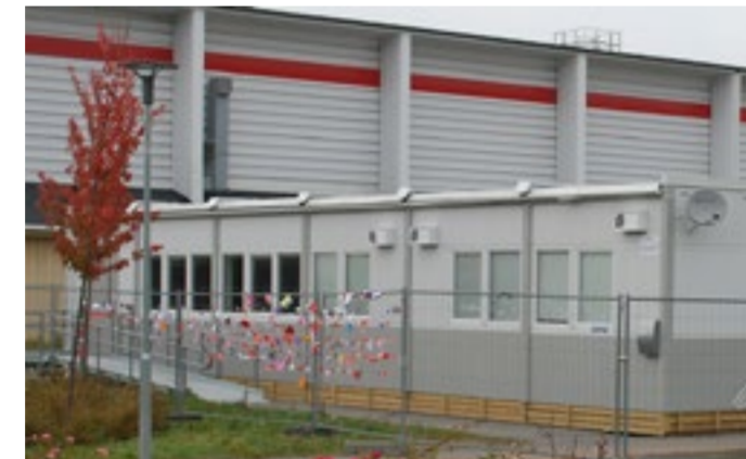
Byggnaden hade ursprungligen tryckimpregnerade brädor som dolde plintarna.

Grannar såg lågor över taket och larmade räddningstjänsten. Ingen verksamhet hade startats i lokalerna. Brandskadorna begränsades till under byggnaden, på ytterväggarna i