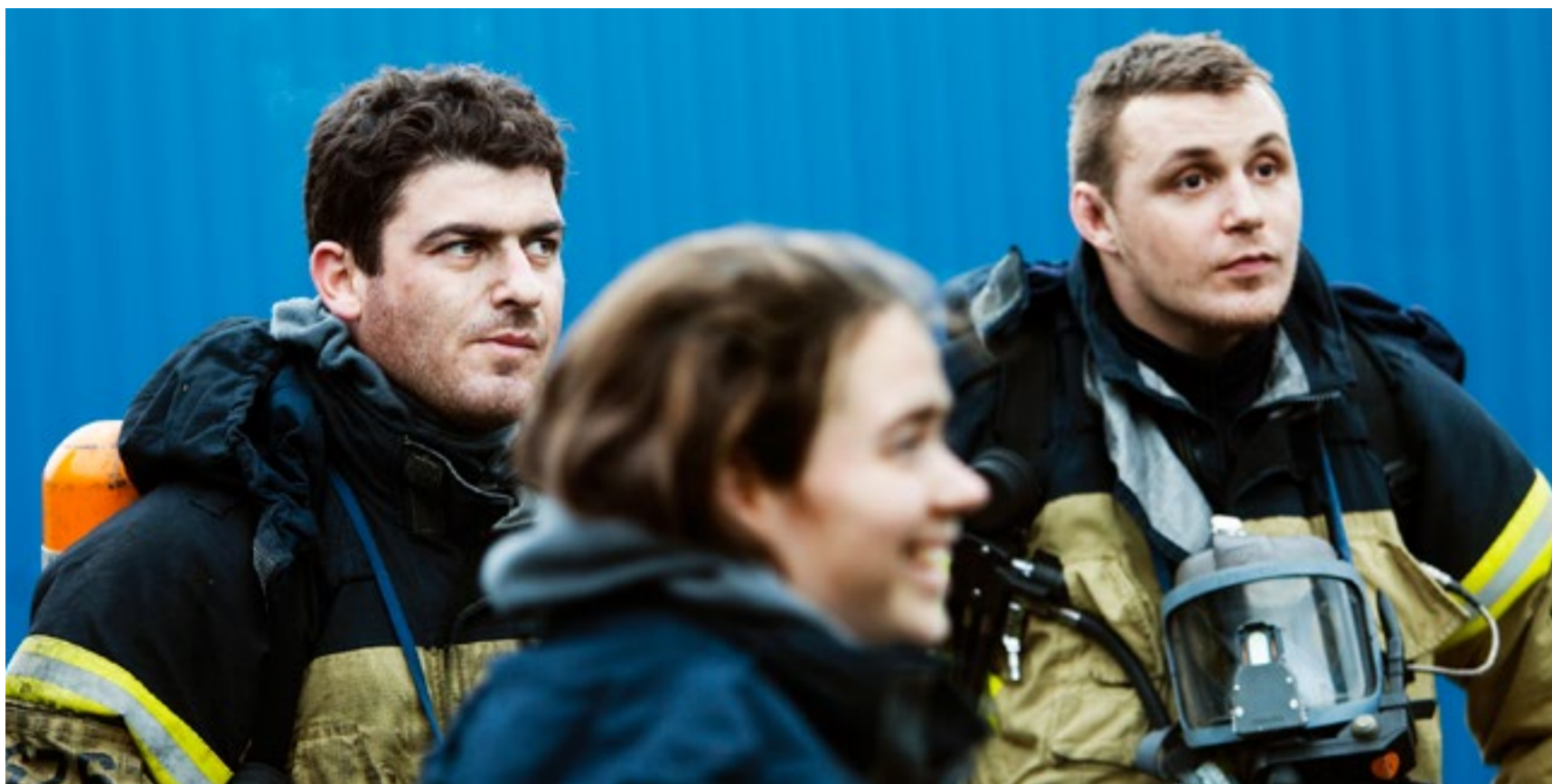
Utredningen är av uppfattningen att fler borde Rib-utbildas. I dag utbildas 500-550 deltidsare varje år medan det verkliga behovet enligt MSB ligger runt 850.