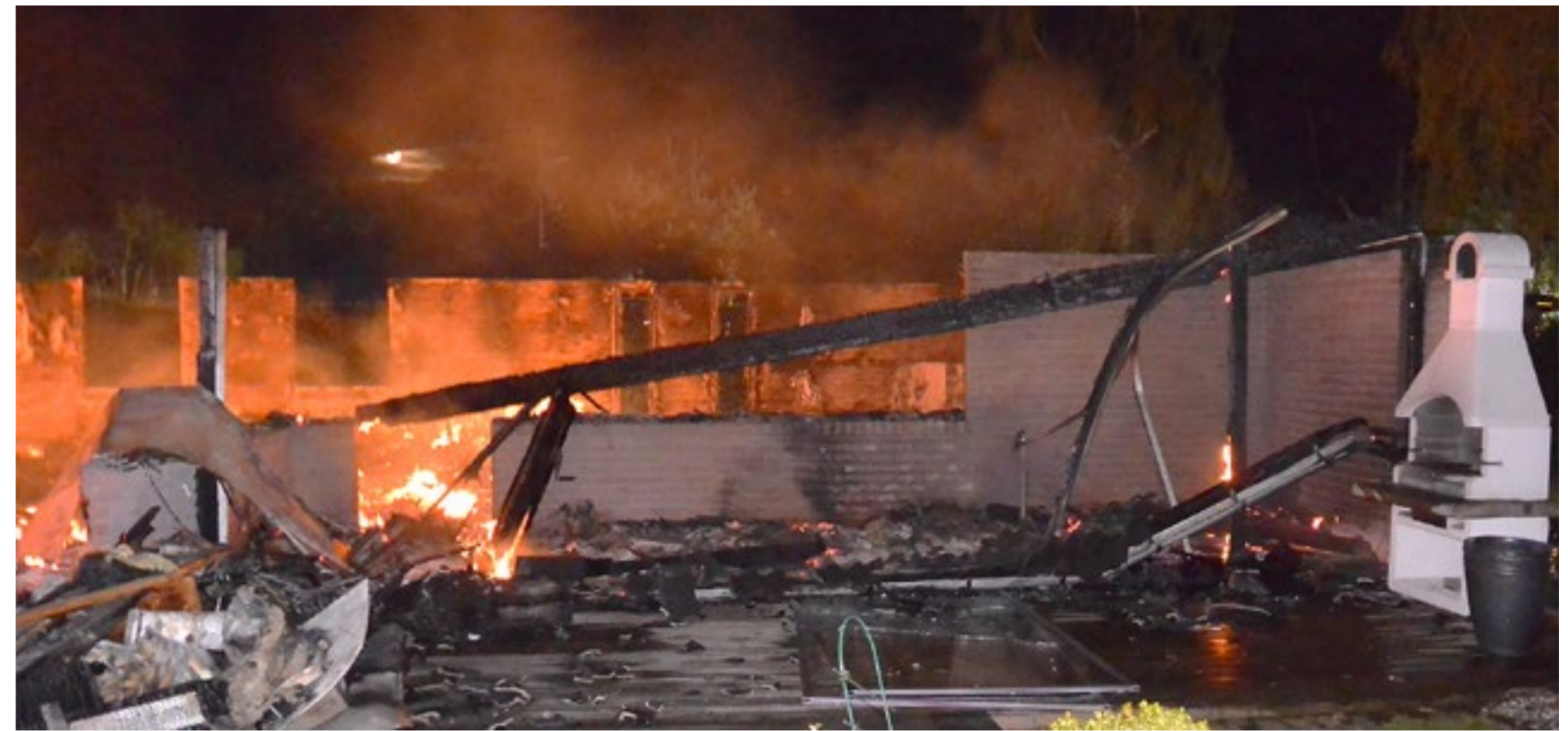
Branden var fullt utvecklad efter tio minuter och huset blev helt ödelagt. Sannolikt slog blixten ner i villan och antände på flera ställen. Grannar beskrev fenomenet med "gnistbollar" stora som knytnävar som sköt upp från taket.

7 Belysning runt byggnaden kan kopplas till rörelsedetektorer för att uppmärksamma om personer befinner sig i närheten.