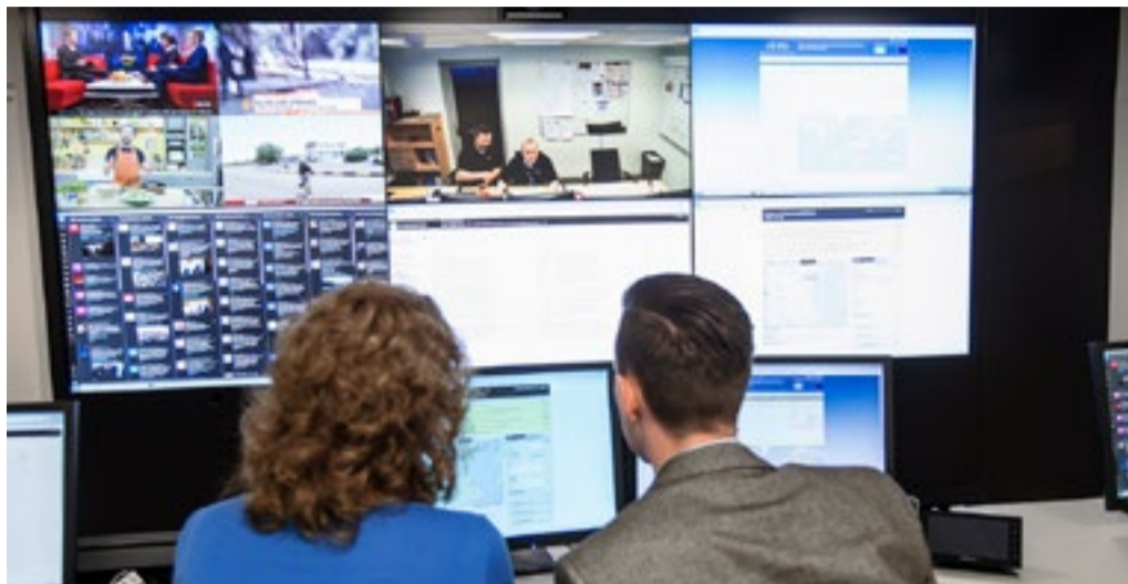
MSB analyserar informationspåverkan både internationellt och nationellt.