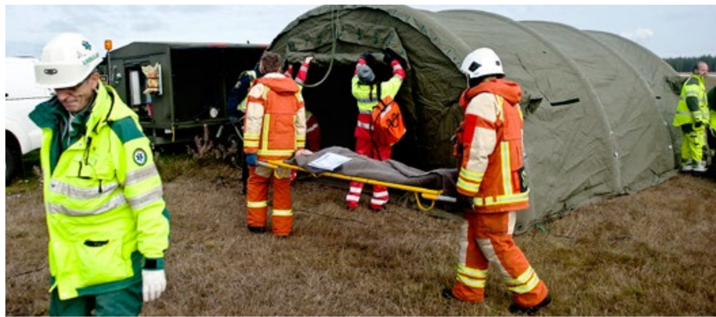
MSB och Försvarsmakten ska komma överens om en grundsyn kring planeringen av totalförsvaret och myndigheter ska börja planera för kriget. På bilden över samhällets samlade resurser i Luleå.

NJR ■ Nätverket Jämsställd Räddningstjänst bildades 2014 och har närmare 40 räddningstjänster som medlemmar. ■ Under hösten kommer NJR besöka områden och räddningstjänster som av olika anledningar inte deltagit så ofta i jämställdhetsarrangemang. ■ Huvudsavaret för NJR skiftar varje år. I år innehas det av Räddningstjänsten Östra Götaland.