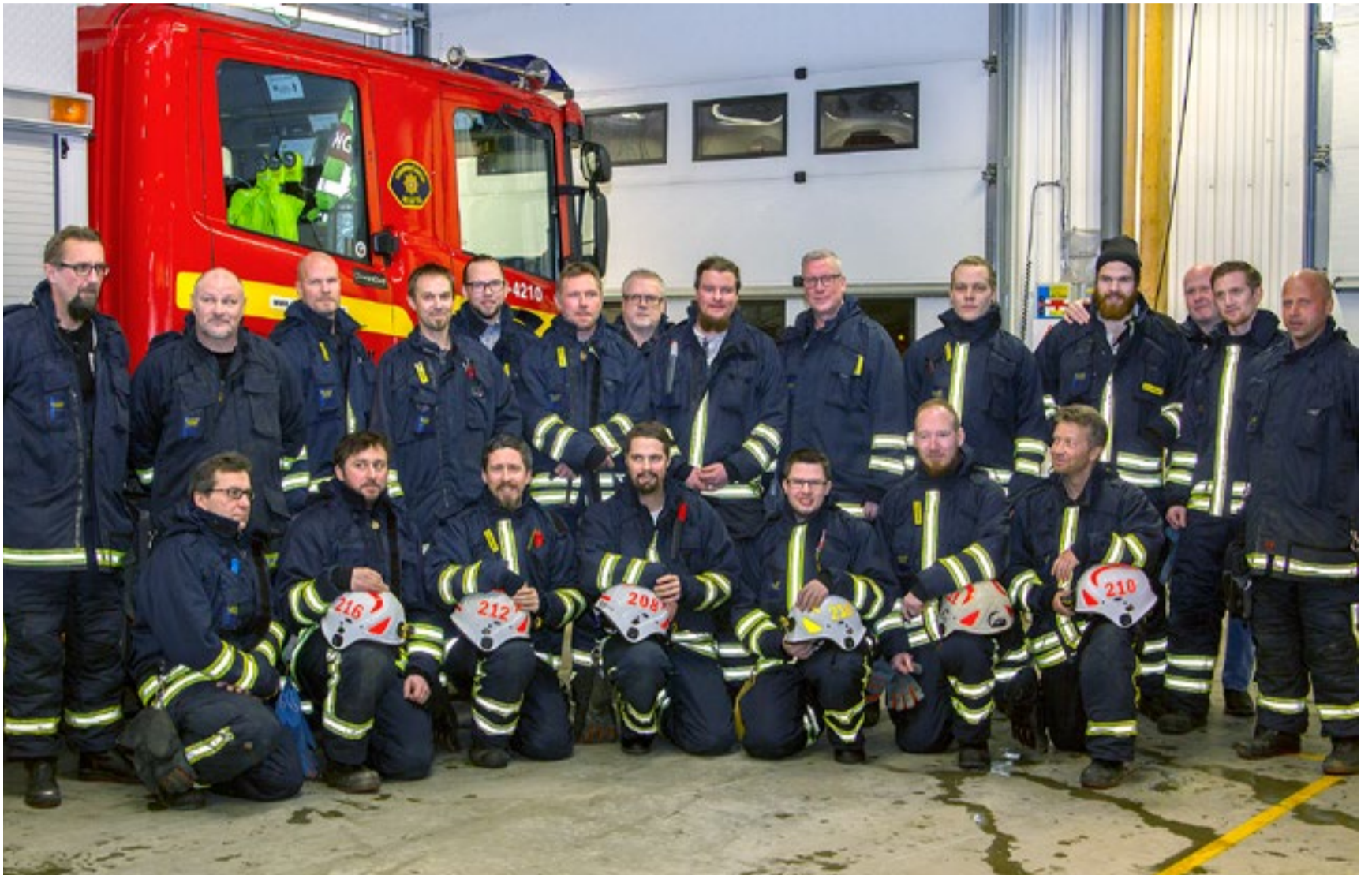
Deltidsgänget i Burträsk som värvade överlägset flest till en ny SMS-tjänst som påminner om att testa brandvarnaren.