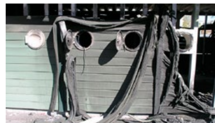
Bränderna i återvinningshus har återkommit. Nu har alla sex i stadsdelen Araby brunnit ner, många bilar har också blivit förstörda i bränderna.

■ Ta bort och omöjliggör intilliggande parkeringar vid denna typ av byggnad.