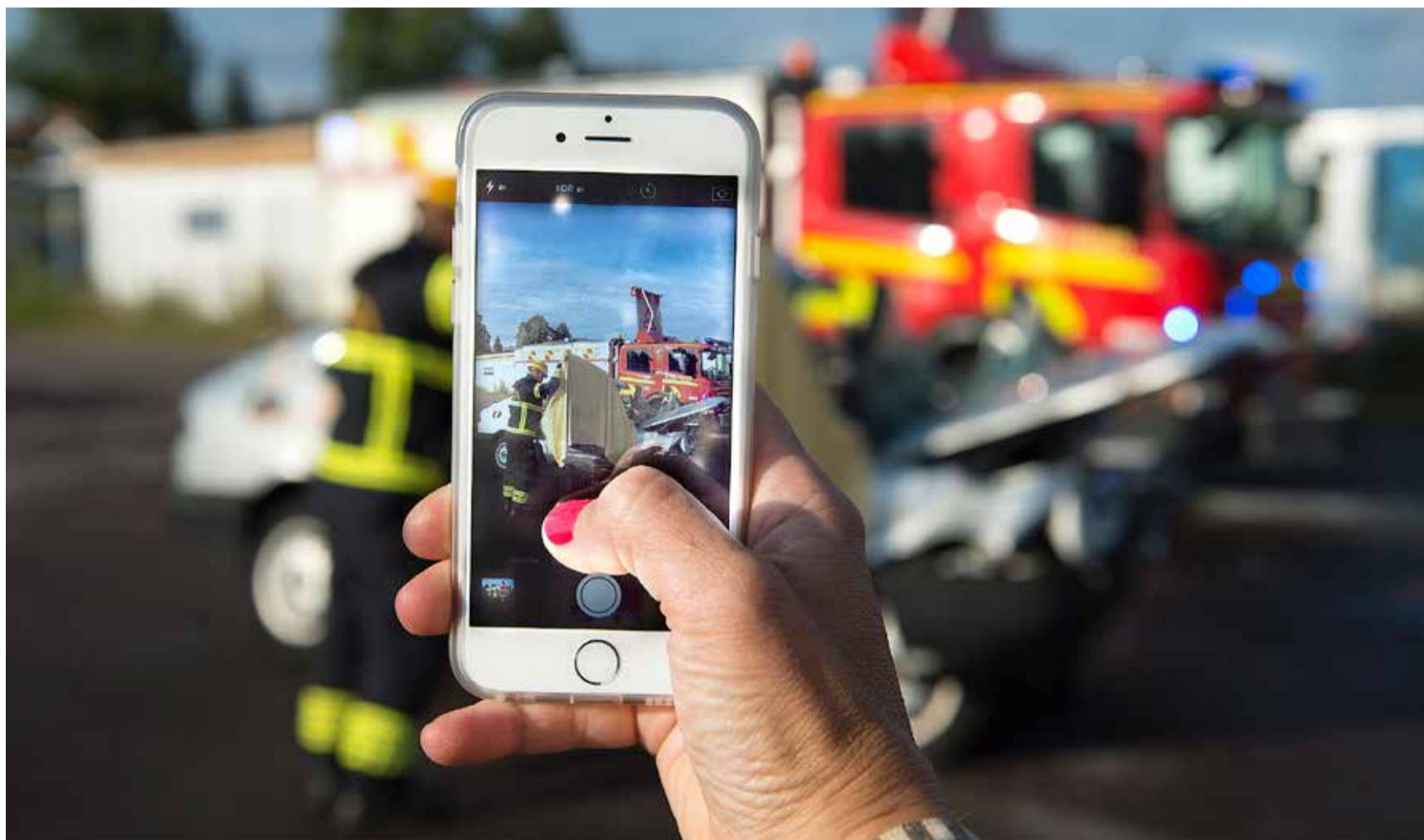
Privatpersoner som tar bilder på olycksplatser uppmärksammas allt mer som ett problem. Det har också hänt att personer prioriterat fotograferande i stället för att hjälpa till.