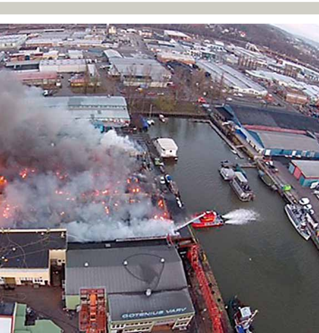
upptäckts. Bilden tagen med drönare.