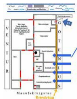
Vid de blå pilarna användes skärsläckare mot brandväggen.

■ På grund av den kraftiga rökutvecklingen användes värmekamera av stegbilspersonalen