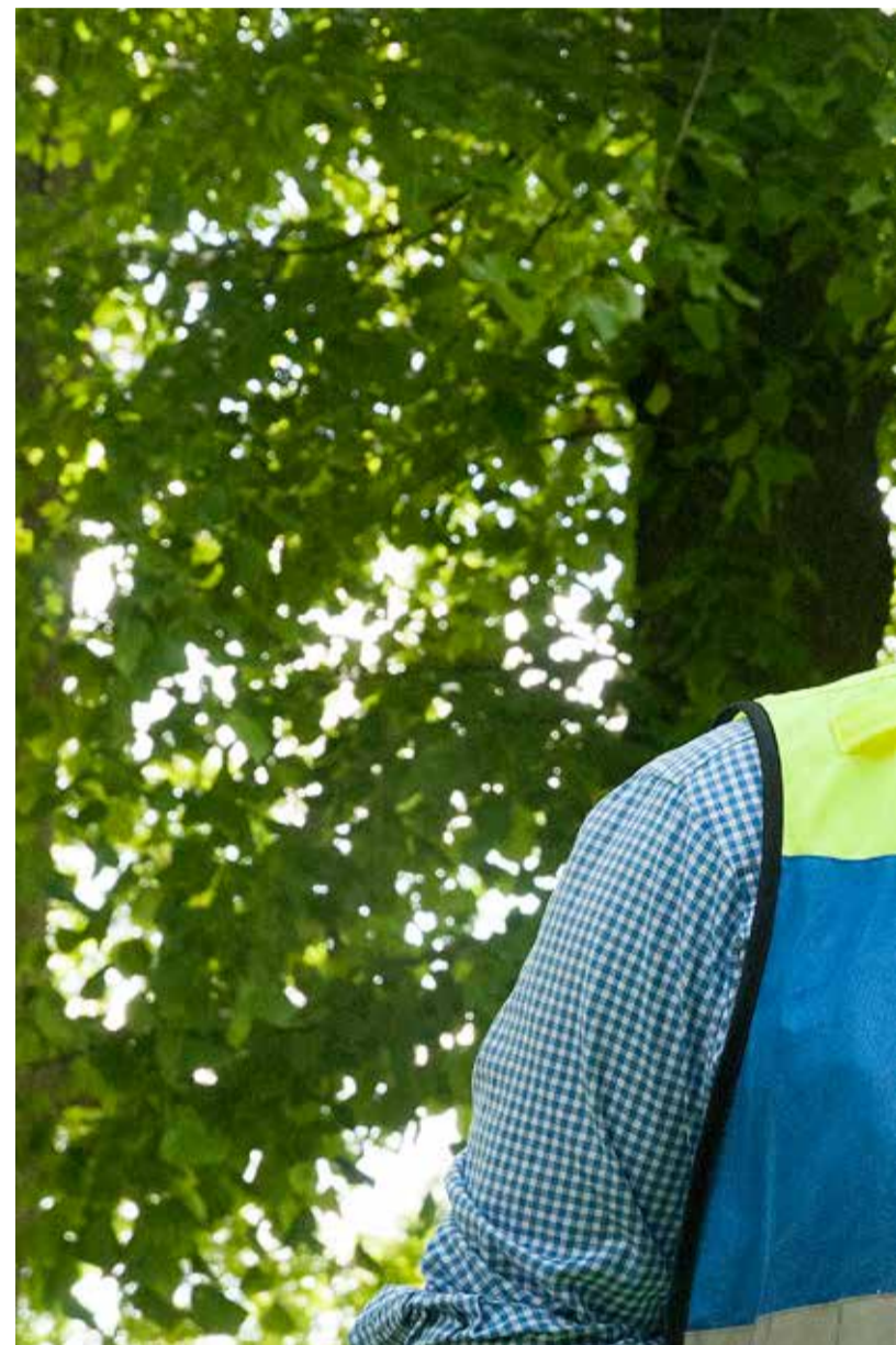
FRG har fått status. Efter skogsbranden i Västmanland framhåller allt fler hur länet tar över. På sikt vill han se en FRG-tib hos MSB som kan aktiveras vid stora

Under skogsbranden blev det tydligt. Det fanns ingen som hade helhetsbild över hur