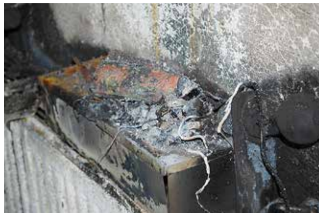
Resten av en av batteriladdarna som brunnit.

Begränsningar den metoden skulle medföra är att ingången där adaptorn användes blockerar angrepp och reträttväg för insatspersonalen samt att befintligt skumrasknät minskar effekten på luftflödet.