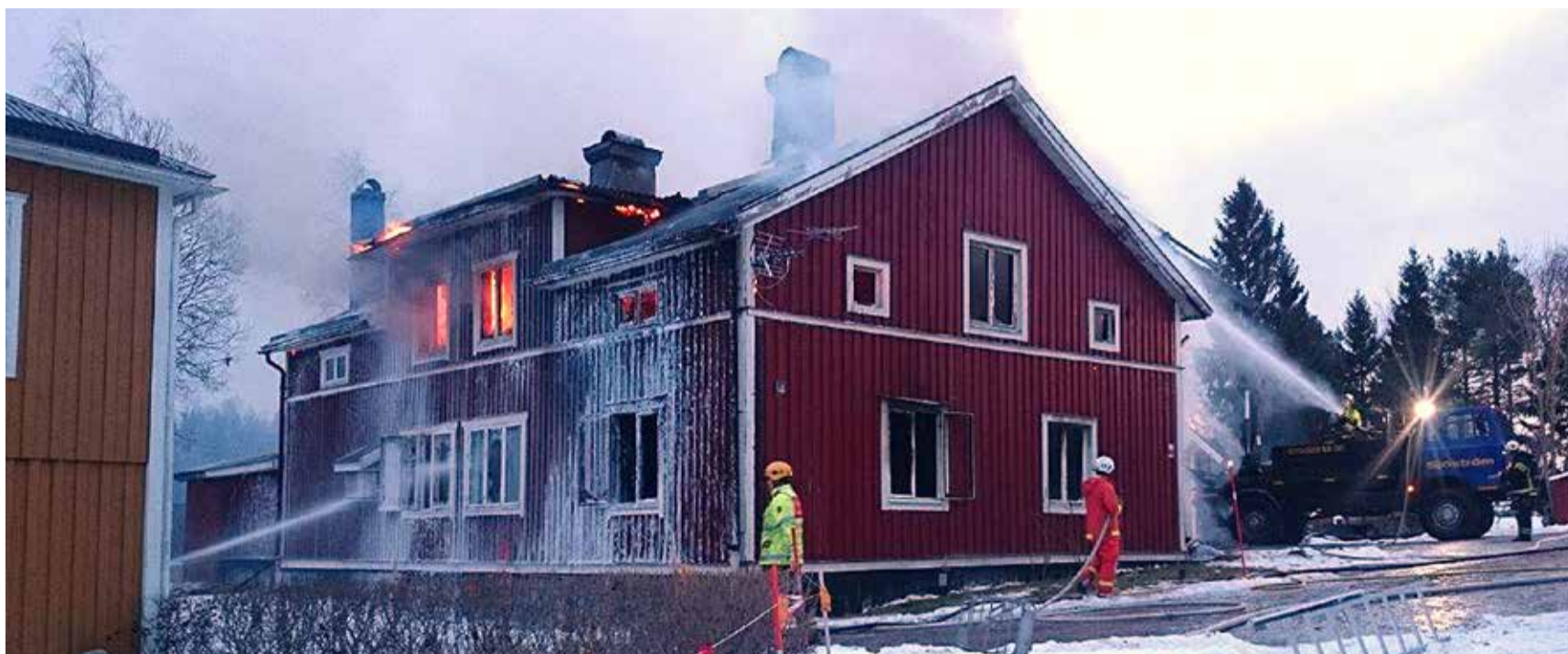
Skum från brandövningar är på väg att bli en stor miljöskandal. Ronneby tvingades stänga sitt vattenverk och öppna en ny vattentäkt sedan brandskum som används F17s brandövningsplats i Kallinge hamnat i dricksvattnet. Bilden från branden i byn Hamre utanför Hudiksvall där brandskum förorenade brunnar i byn.