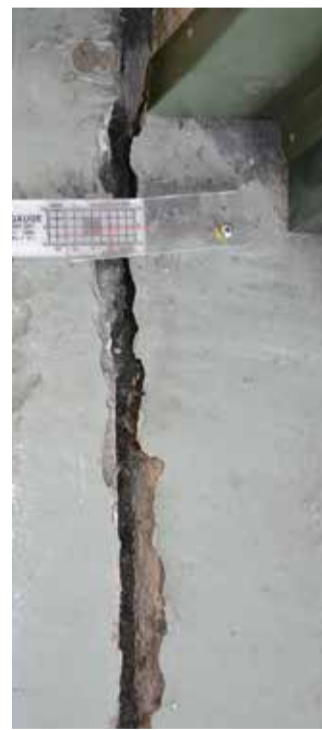
En av de större sprickorna i golv, cirka två centimeter bred.