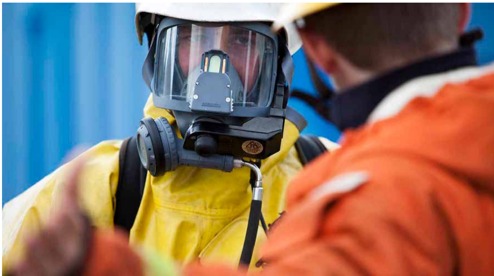
En enkät från Tjugofyra7 visar att det kan vara upp mot tio procent av landets deltidsbrandmän som saknar utbildning i räddningsinsats.