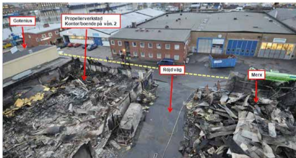
Gotenius var en av begränsningslinjerna som hölls med vattenbegjutning både från stegbil och brandbåt, samt att skärsläckare och fläktar användes för att kyla brandgaser och sätta övertryck. Den gula, streckade linjen visar Manufakturatan.