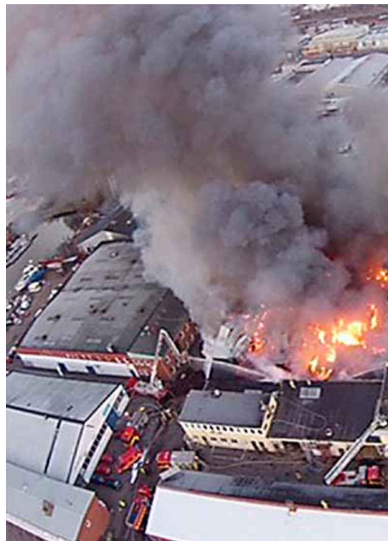
Brandområdet 08.35, drygt två och en halv timme efter att branden hade