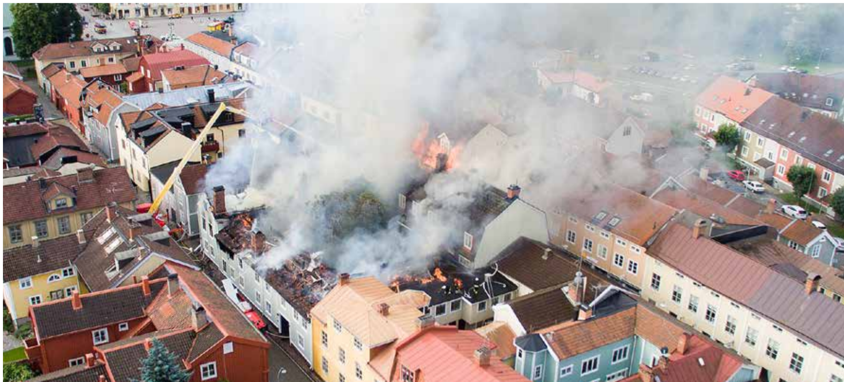
Branden i gamla stan i Eksjö blev omfattande, en kvinna omkom. Med larmet inkopplat hade det aldrig hänt, hävdas det. Branden kommer att granskas i flera utredningar.