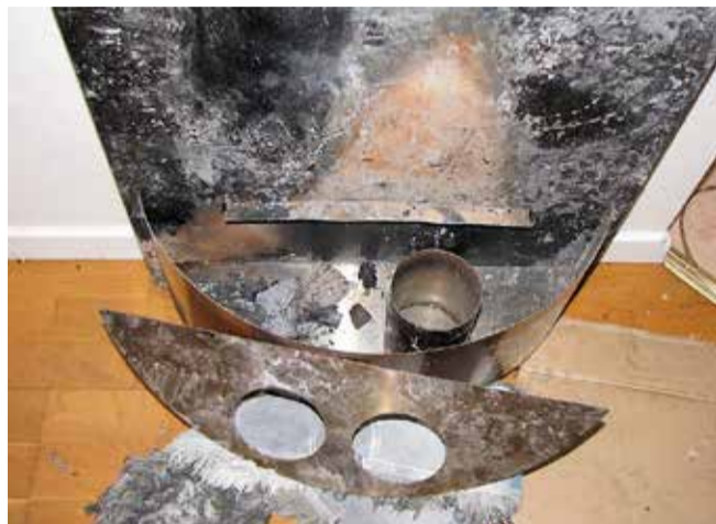
Under halvmånelocket samlas vätskan vid spill och avger brandfarlig gas.