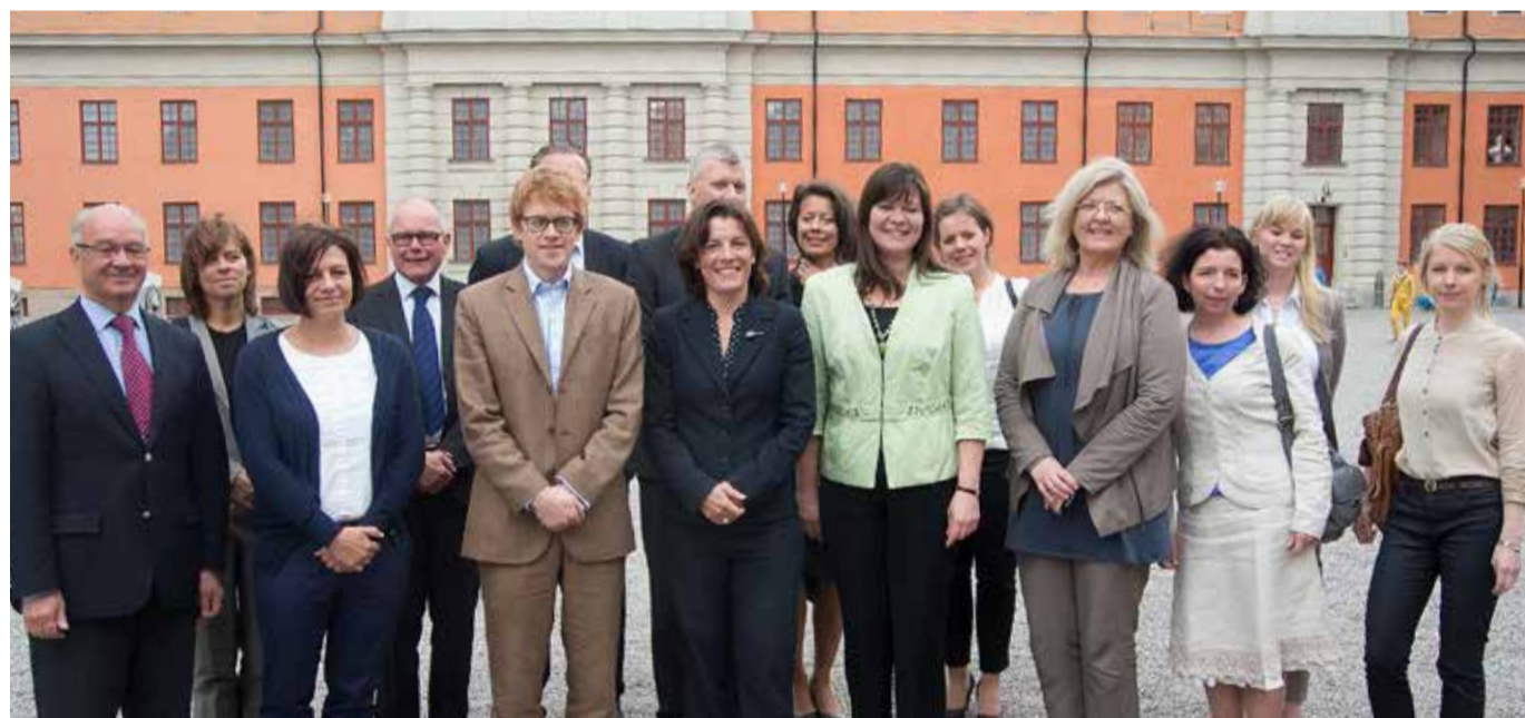
Försvarsminister Karin Enström tillsammans med representanter för de nordiska länderna som i juni hade samlats i Vaxholm för att anta en ny Haga-deklaration.

ett robust Norden utan gränser. Det innebär att samhällets sårbarhet ska minska samtidigt som förmågan att hantera allvarliga olyckor och kriser stärks. I den nya deklarationen konstateras att det nordiska samarbetet bör fördjupas ytterligare och att man ska arbeta mer strategiskt.