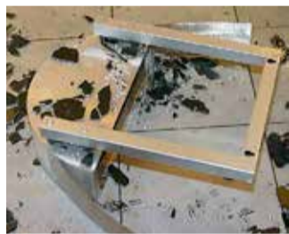
Baksida på kamin med hål för infästning.

för spritbränsle hade ramlat ner på klinkergolvet. Några deciliter av den brinnande vätskan hade läckt ut och runnit in under en försäljningsdisk som tagit eld.