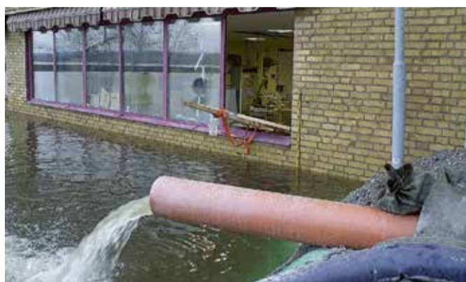
Större risk för översvämning – en konsekvens av klimatförändringar.

Båda menar att frågan är komplicerad och svår att jobba med lokalt. Kommunala tjänstemän saknar nationella riktlinjer att luta sig emot och det finns en besvikelse över att man från central nivå inte har gjort mer.