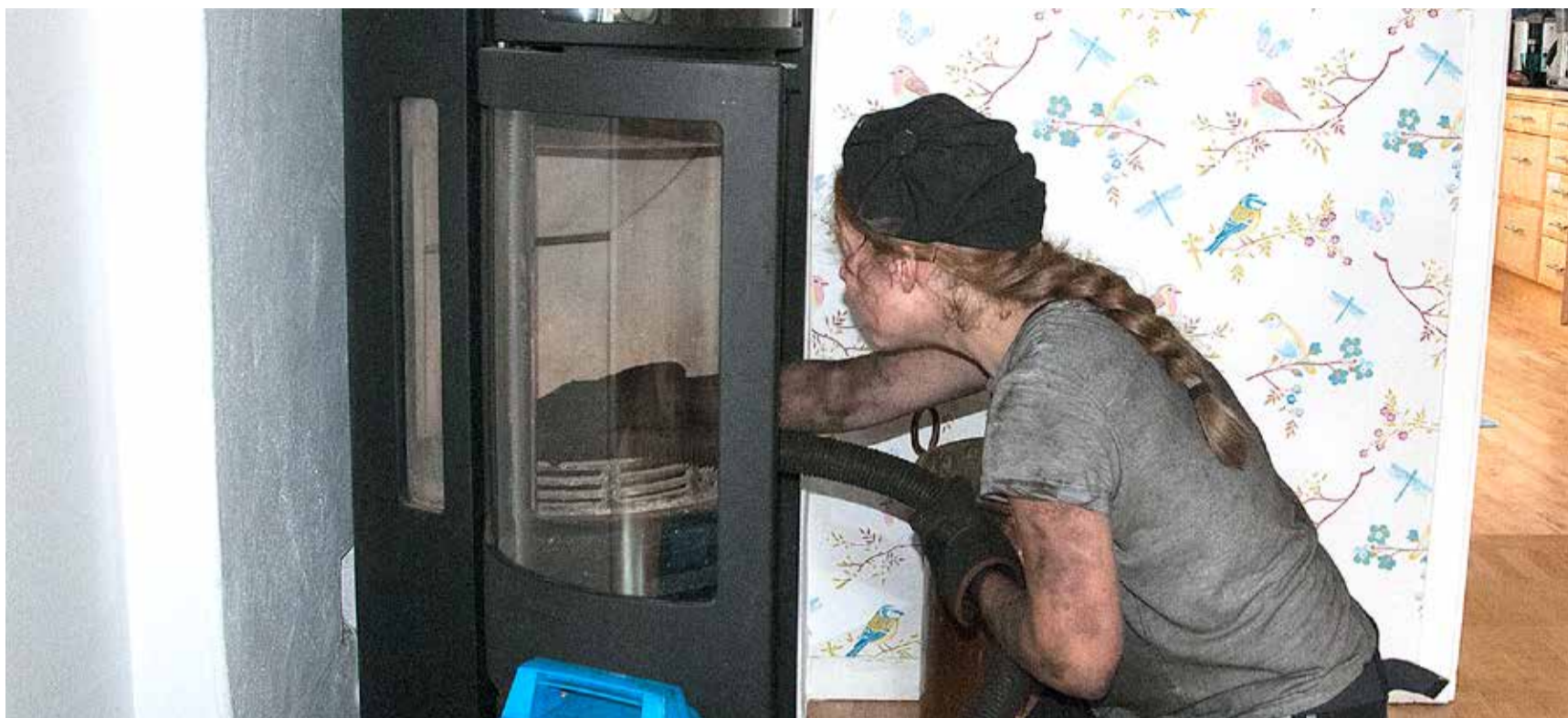
Kommuner får mängder med ansökningar om egensotning där behöriga sotare ska anlitas. Branschen anser att nuvarande reglering för sotningen inte fungerar.