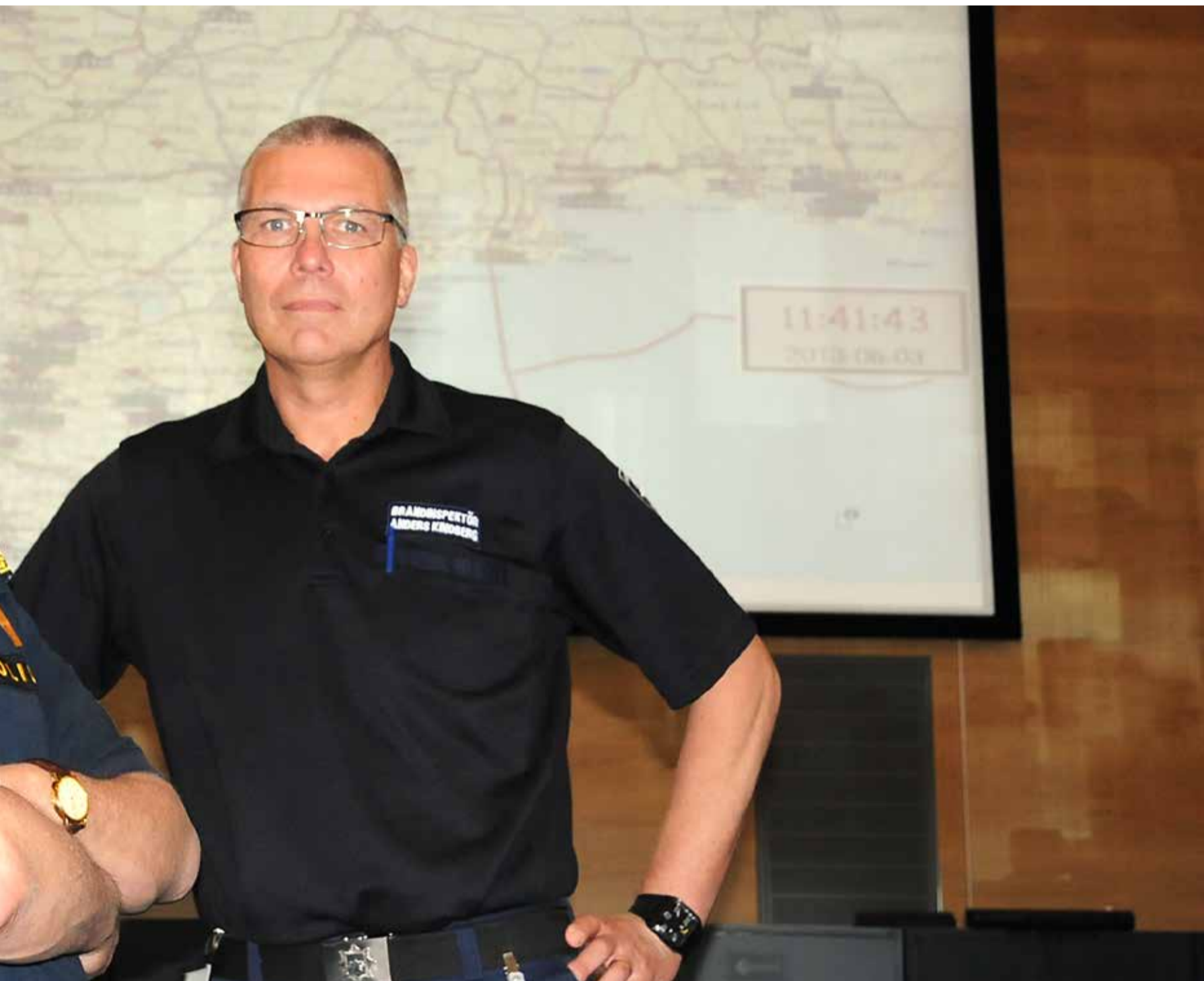
Arbete som utvecklas när samtalsgrupperna för blåljusmyndigheterna börjat fungera på allvar.