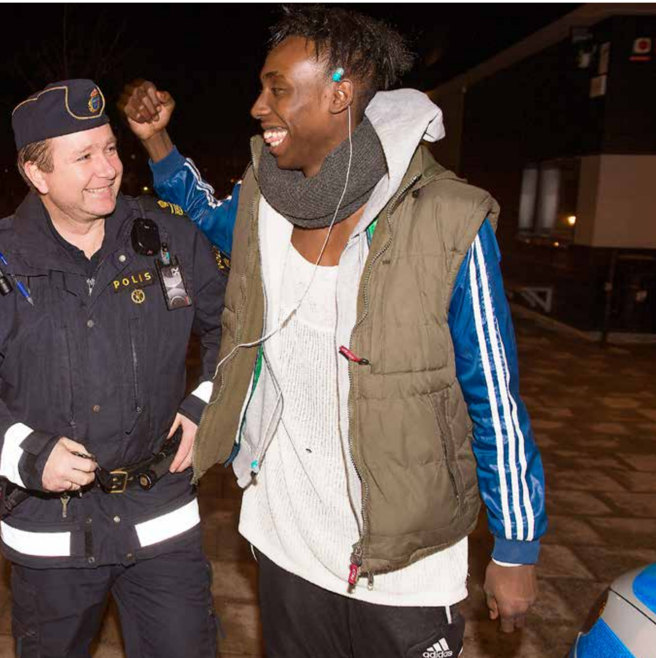
ook. – Jag tror många ni ser oss som vanliga människor, fast med ett ovanligt jobb, säger han.