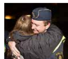
Många vill kramas.

krav man ställer på föräldrarna är att de kommer och hämtar sina barn om polisen ringer. Inlägget blev omskrivet i Washington Post.