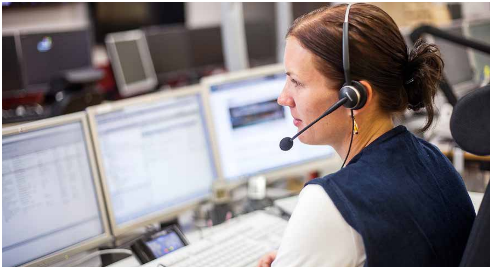
Alarmeringstjänsten bör hanteras i myndighetsform och då är det lämpligast att placera verksamheten hos MSB, anser MSB.