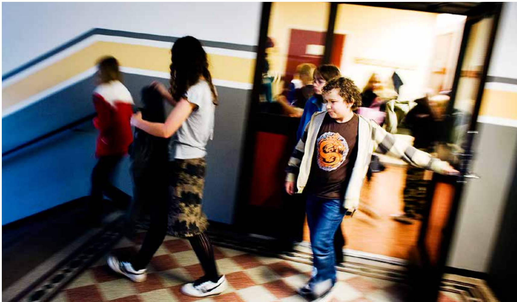
Skolor är ofta utsatta för bränder. Forskning visar att det i förebyggande syfte är väsentligare att vända sig till individer i riskzonen för att anlägga bränder än att bedriva generell utbildning i skolan (arkivbild).