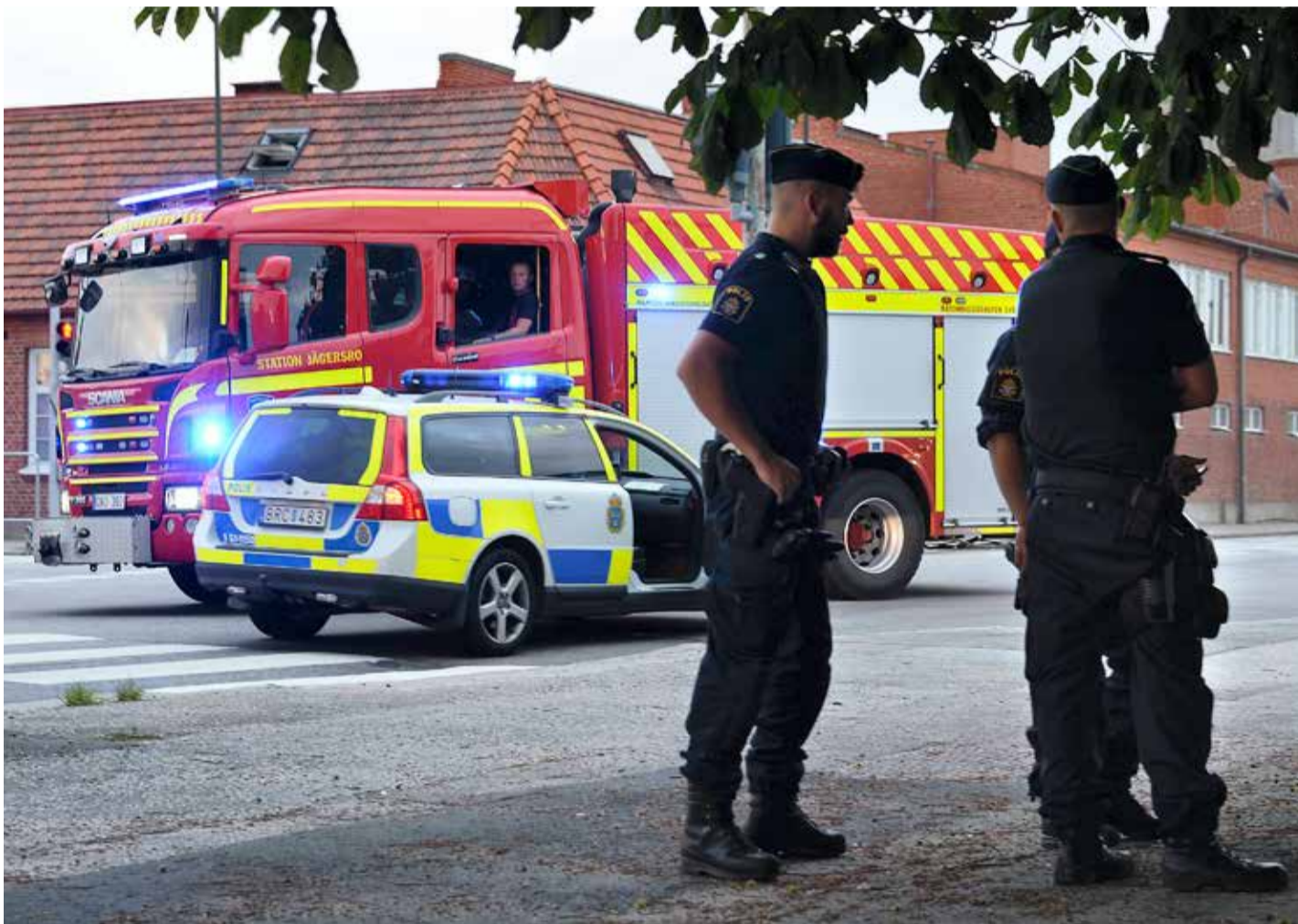
Ett utvecklat samarbete mellan polis och räddningstjänst innebär att båda parter anser sig få bättre stöd i prioritering och blir effektivare.