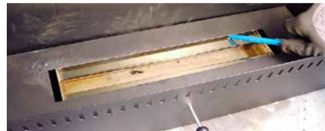
Här syns den rostfria behållaren för bränslet med den svarta horisontella plåten som ligger över behållaren. Spiller man på den svarta plåten rinner bränslet mellan frontplåten och den falsade bottenplåten och ur kaminen.

2 Läs alltid varningstext och bruksanvisning innan du tar en ny apparat eller förpackning med brandfarliga ämnen i bruk för första gången.