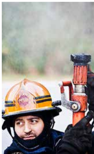
Efterfrågan på utbildning i räddningsinsats har lett till minskade kommunala bidrag. Pengarna behövs för att öka utbildningen.

■ 1986 startade Räddningsverket en fyra veckor lång utbildning kallad "brandman deltid". Formellt en civilförsvarsutbildning, de utbildade krigsplacerades i civilförsvaret. Senare utökades utbildningen med en femte vecka med fokus på sjukvård. ■ Deltagarna fick en dagpenning baserad på den sjukpenninggrundande inkomsten. ■ 1995 kom ny lag om totalförsvarsplikt, räddningstjänstlagen ändrades att omfatta räddningstjänst under krig och det statliga civilförsvaret upphörde. Ut-