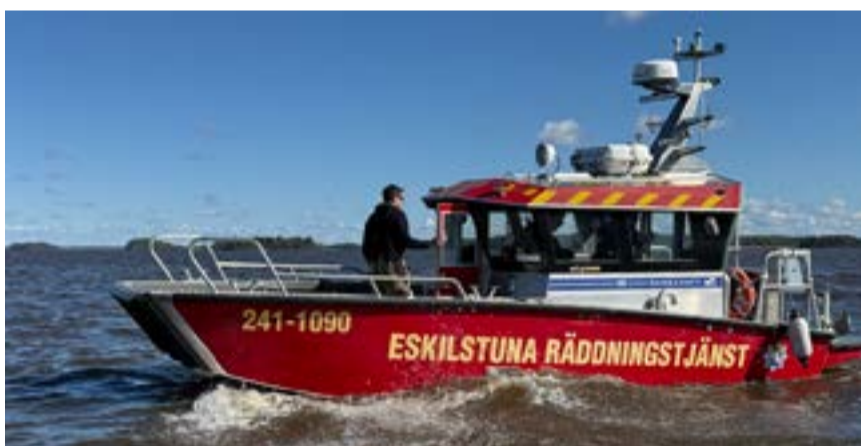
Det var många organisationer inblandade i arbetet med att lokalisera och omhänderta utsläppet.