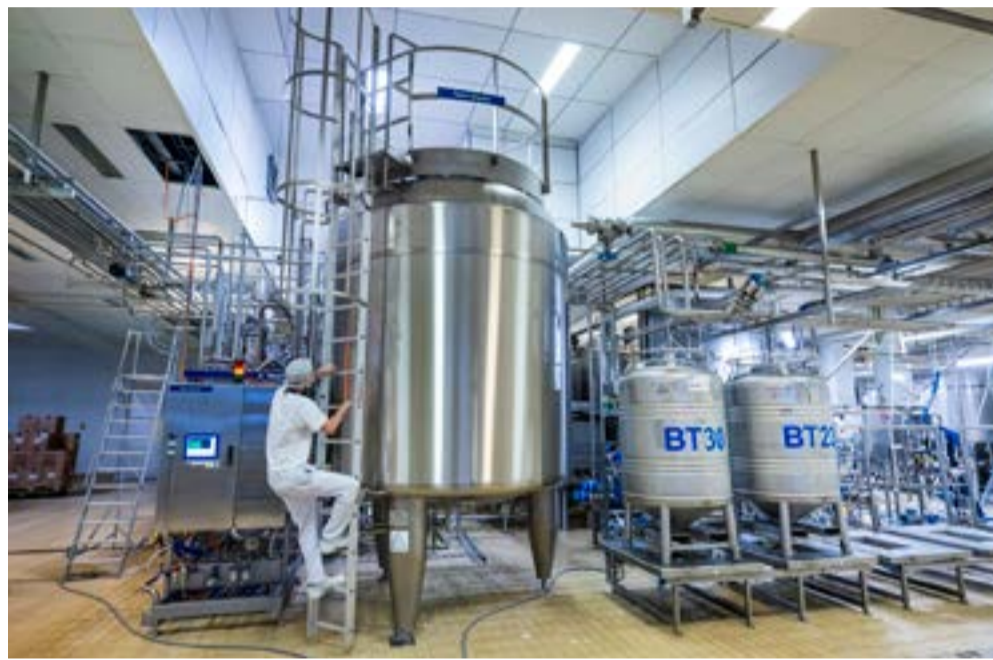
På uppdrag av Livsmedelsverket har forskningsinstitutet Rise undersökt i vilken utsträckning 3D-printning gör det möjligt att tillverka, återskapa eller reparera reservdelar lokalt för att minska ledtider och beroendet av globala leverantörsnätverk.

I projektet genomfördes detaljerade studier av fem reservdelar med olika tekniska funktioner. Man 3D-printade vattenfilter, diskmaskinslock och luftningsdysor i plast – där luftningsdysan an-