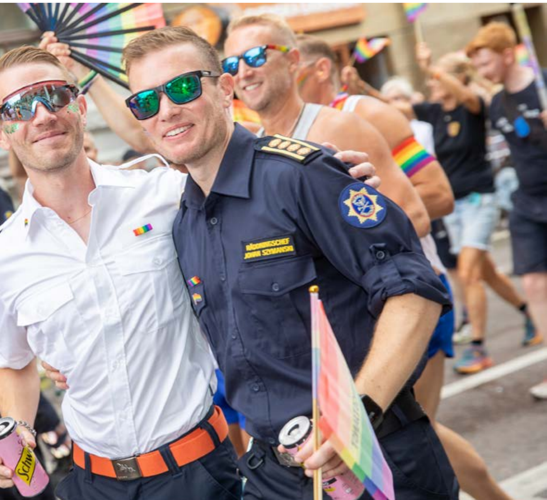
ledaren året innan som brandchefen för första gången kom ut för kollegorna.