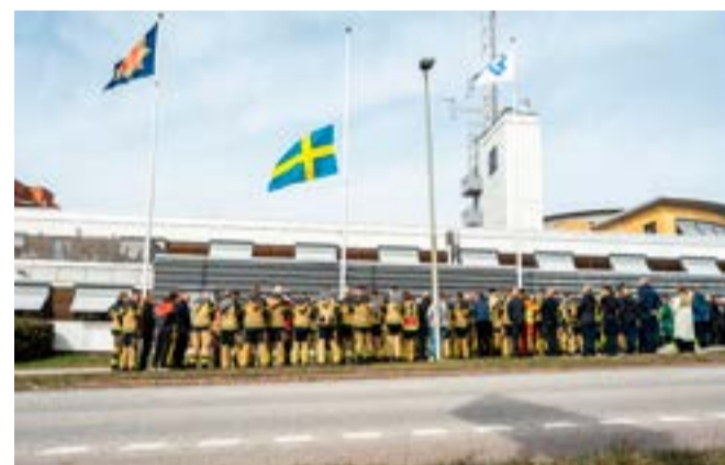
Kollegerna samlades till en tyst minut dagen efter olyckan. Liknande ceremonier hölls på räddningstjänster över hela Sverige.