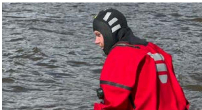
En ovanlig dag på jobbet för räddningstjänsten i Eskilstuna, som fick öva på att ta hand om ett oljeutsläpp.