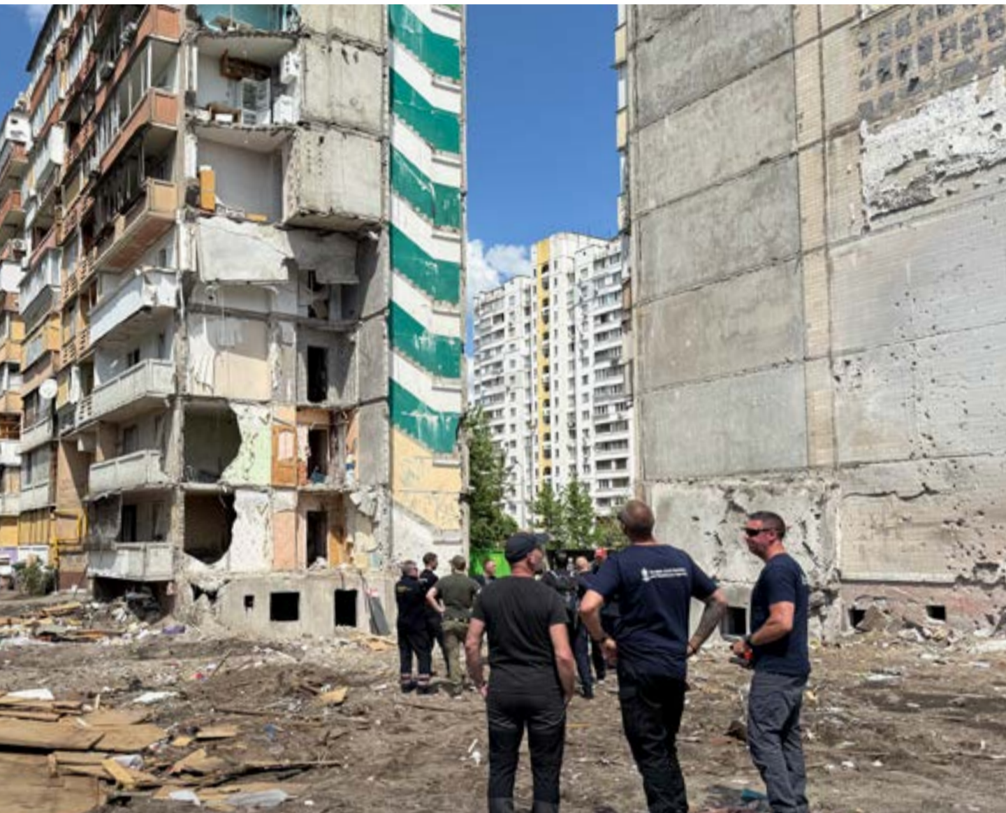
när en missil slog ner i bostadshuset. En vecka senare är det mesta redan undanröjt.