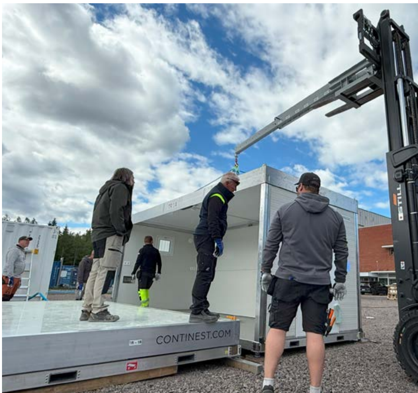
Nödbostäderna ger EU ett rejält tillskott när det gäller förmågan att ge nödställda människor ett tillfälligt hem. Personerna som är utvalda att på att sätta upp bostadsmodulerna.

– Det är ett mycket stort engagemang. Vi har 70 personer i den här resursen, men det var