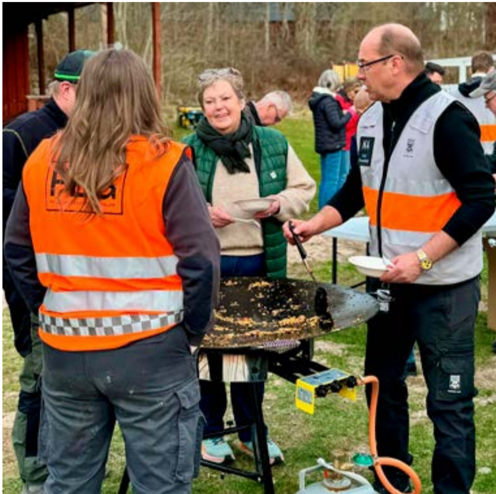
Hur stekhällarna och den övriga materielen funkade testades på den välbesökta kick-offen.