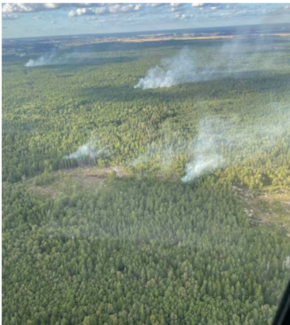
Inledningsvis underskattades brändernas omfattning och spridning.