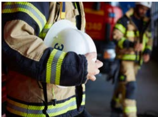
21 av 24 deltidbrandmän har nu sagt upp sig.

Nyheten väckte stor oro i samhället när den kom i maj.