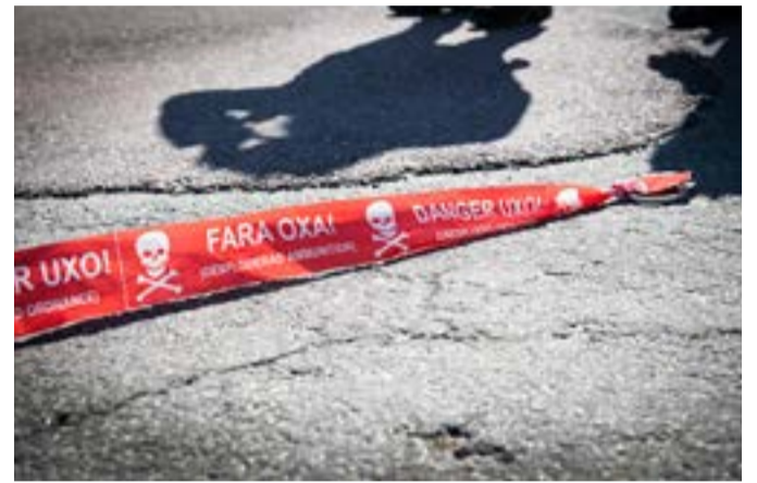
RUHB-utbildningen genomförs mot en bakgrund av illvilja som är ny för svensk räddningstjänst. Hoten kan vara fysiska på marken men också komma från luften.