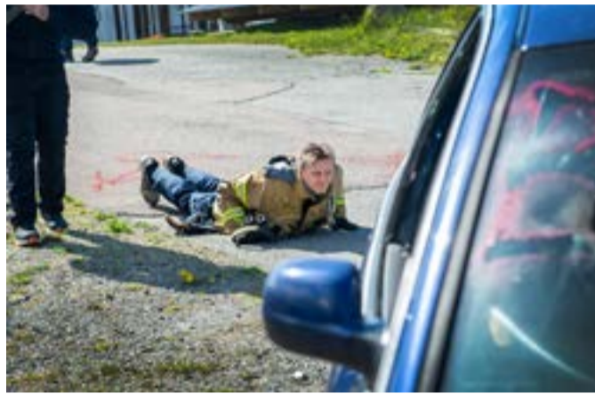
Sprängmedel på den fiktiva olycksplatsen innebär ett nytt och farligt riskmoment där svåra beslut måste fattas under press. Ett misstag kan få ödesdigra konsekvenser.

– Vi måste lära oss att hitta det onormala i den norma-