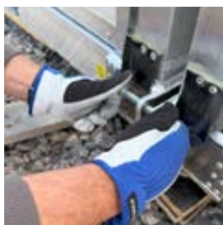
Två moduler kopplas ihop till en.