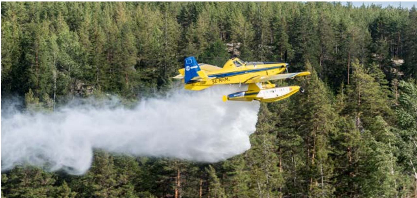
EU:s gemensamma förstärkningsresurser kommer utökas med fler flygplan och helikoptrar. Men det räcker inte för att möta det växande skogsbrandshotet i Europa.