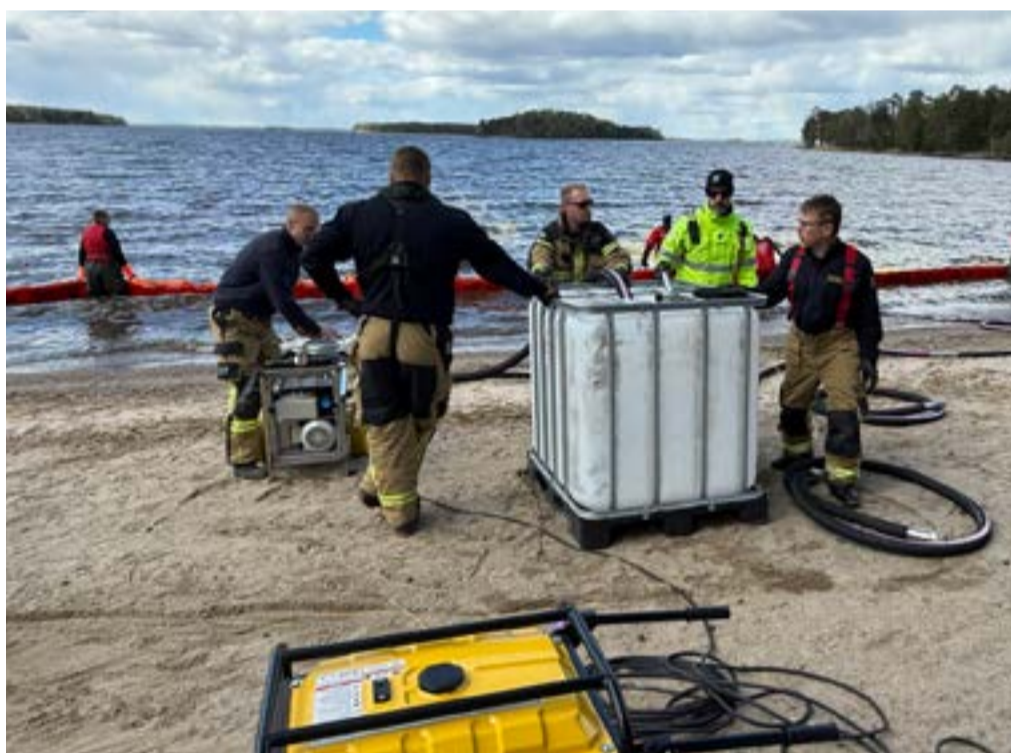
Att testet att pumpa upp "olja" i tankar på stranden blev lyckat var ett intressant resultat av övningen.