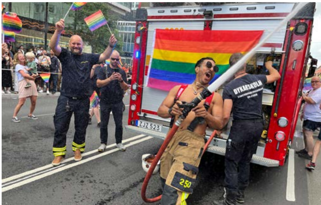
Det är upp till varje arbetsgivare att avgöra om den kommunala räddningstjänsten får delta i Pride i uniform. Så här brukar det se ut i Stockholm Pride.