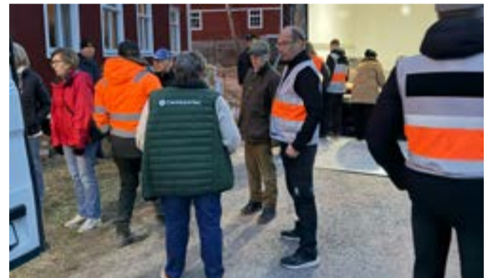
Utdelningen av materielen skedde vid en kick-off på Rytterne hembygdsgård, hemvist för en av de deltagande föreningarna.