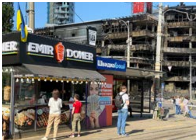
Den lilla kebabkiosken klarade sig utan en skråma och har fullt med kunder dagen efter den stora attacken i Lukianivska.