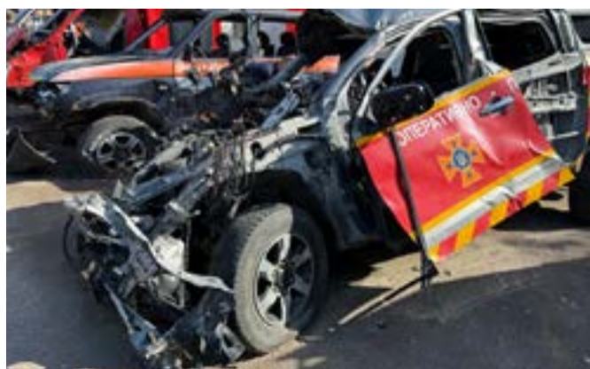
Ett besök på en brandbilskyrkogård stod också på schemat.