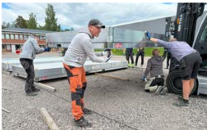
Den här gången var det ett övningsområde i Kristinehamn. Nästa gång kanske det är ett katastrofområde någonstans ute i Europa.