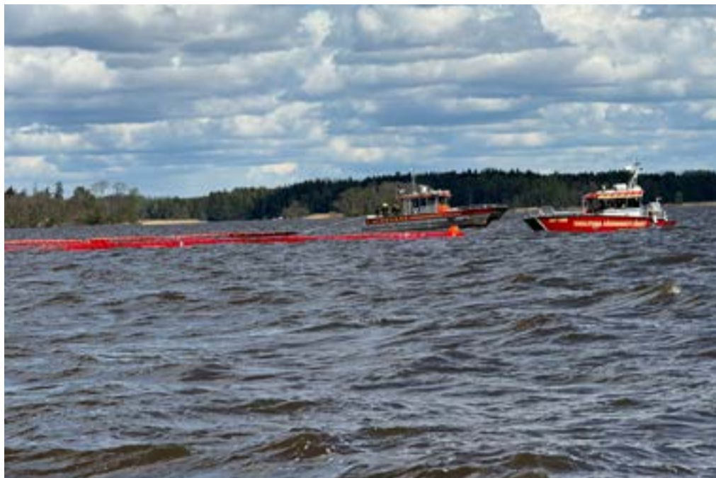
Övningen var komplex med många olika insatser över en stor geografisk yta. Här samlar man ihop olja ute på öppet vatten.