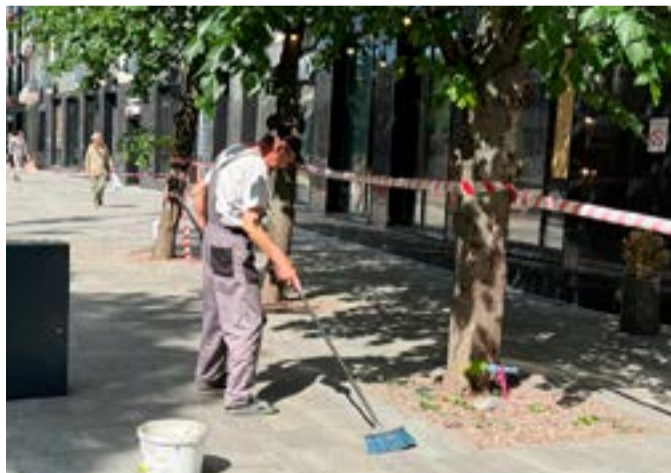
Direkt efter attackerna röjs det undan, glassplittret sopas bort och vardagslivet fortgår.

KIEV • Natten till den 24 maj genomförde Ryssland en av de största attackerna mot Ukraina hittills. 90 missiler och 600 drönare avfyraades. Tjugofyra7 var på plats i Kiev under den dramatiska natten och dagarna efter.