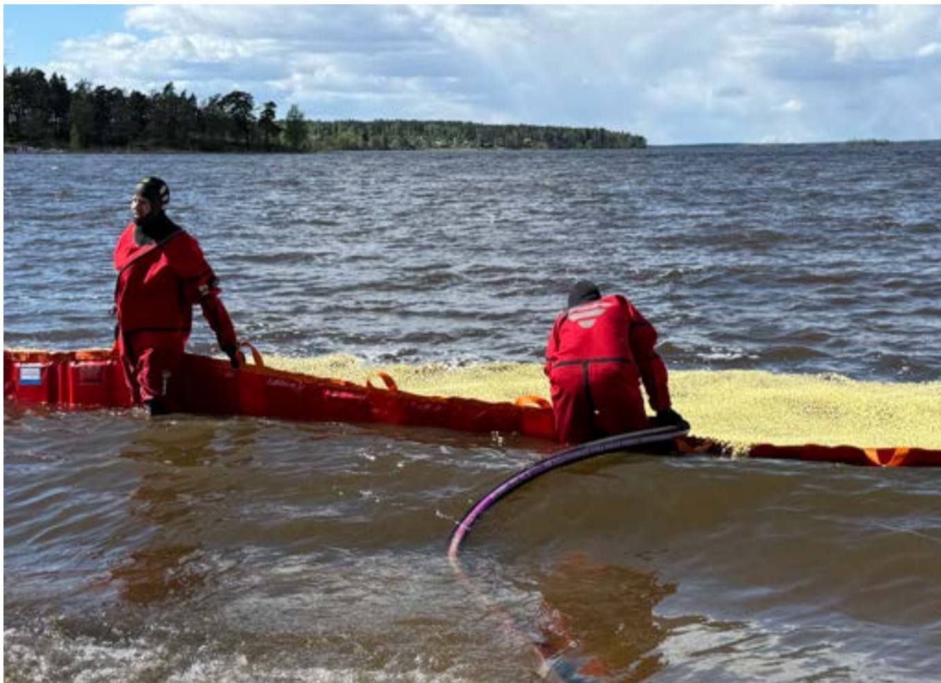
Tekniken att samla upp oljan – i det här fallet popcorn – och pumpa upp den till tankar testades här med lyckat resultat.