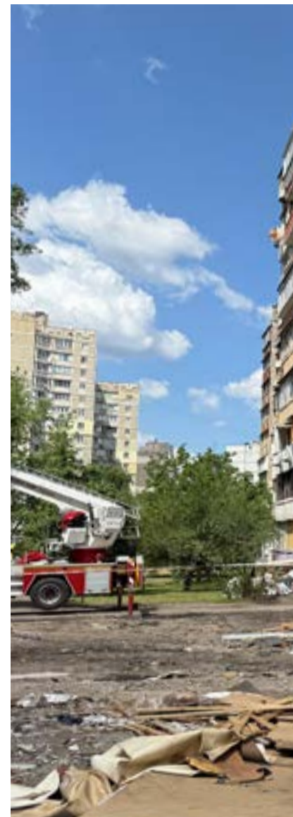
Den 14 maj i år omkom 24 personer här

– Vi har ju aldrig varit i närheten av något liknande. Möjligtvis skogsbränder – fast här kan det finnas minor i skogs-