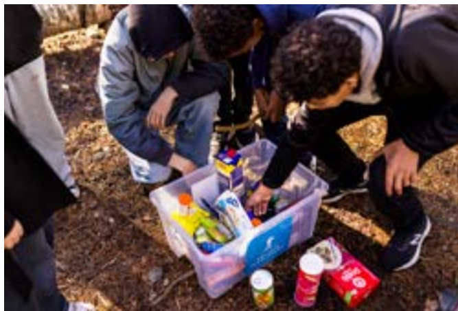
Under Beredskapsveckan förra året tränades högstadieelever av Friluftsförbundet.